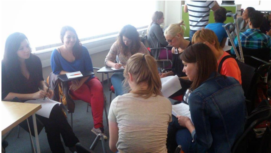
Képek a csoportmunkáról: